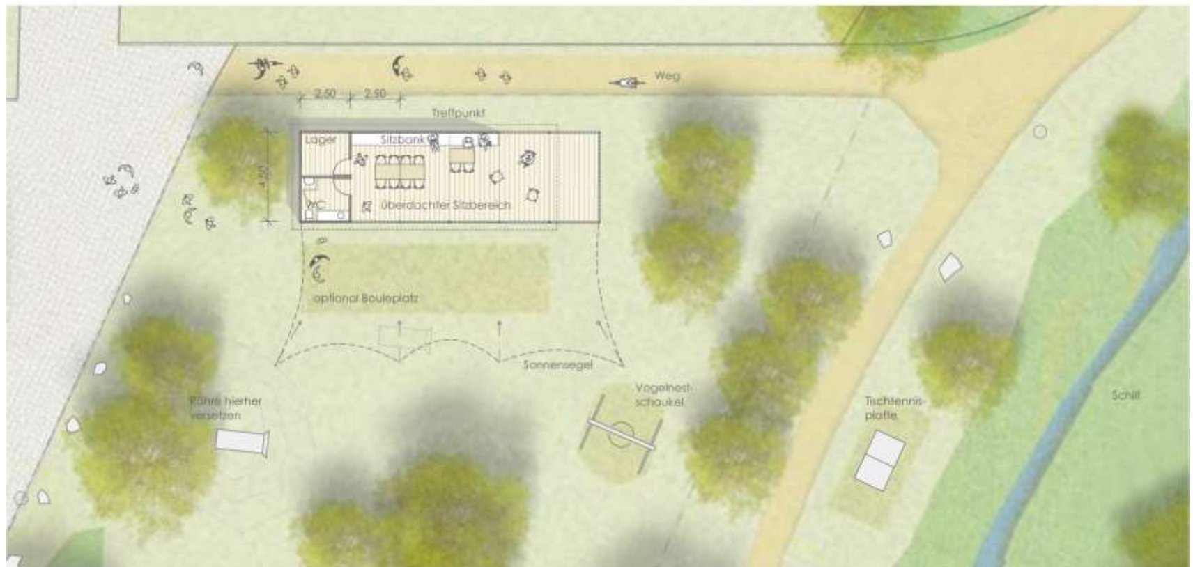
Grundriss offener Pavillon